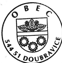
Miloš Valášek starosta

Vyvěšeno na úřední desce dne: 4. 10. 2017