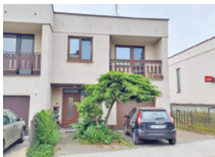
Chráněné bydlení ve Dvoře Králové nad Labem – Růžový dům.

Na území města Dvůr Králové nad Labem se nacházejí dva rodinné domky, v nichž je poskytována pobytová sociální služba Chráněné bydlení . Klientům poskytují podporu pracovníci v sociálních službách, a to v rozsahu jejich individuálních potřeb. Klienti jsou vedeni k vlastní zodpovědnosti a samostatnosti. Podílí se na činnostech zajišťujících chod domácnosti. Jedná se např. o pravidelný úklid, nákup potravin, vaření či celkovou péči o svůj domov. V místě svého bydliště rovněž klienti využívají běžně dostupné služby – restaurace, kadeřník, pedikúra, obchody apod. Chráněné bydlení organizace má své další domácnosti v